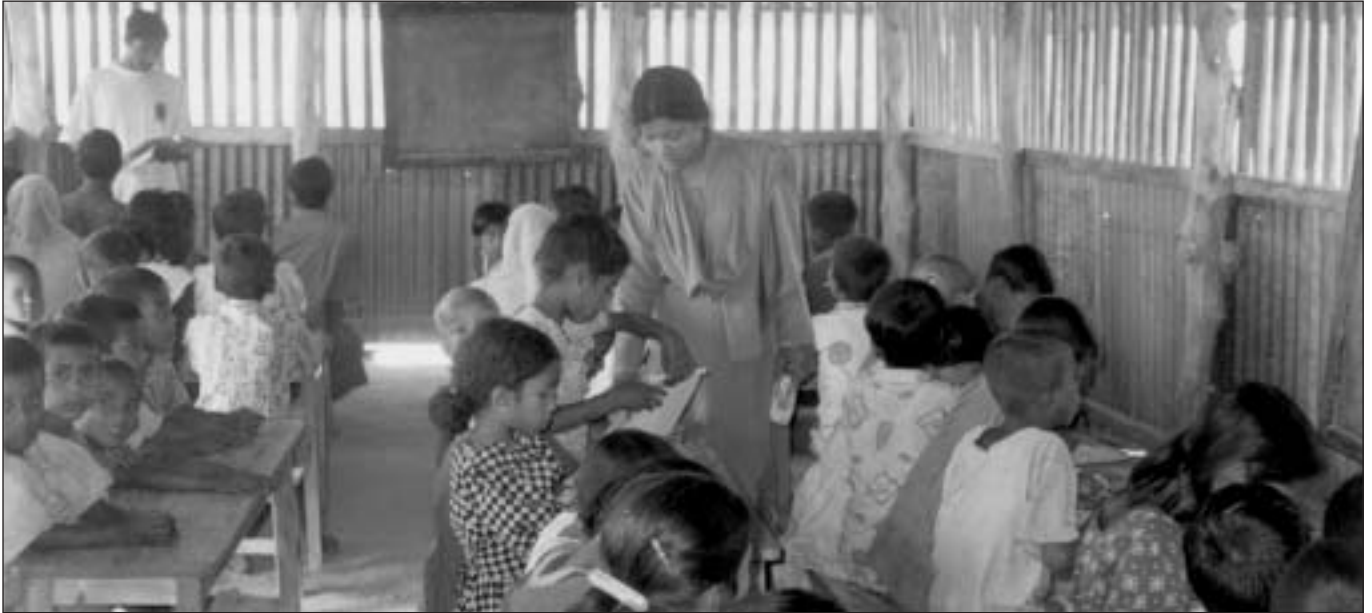
Dit is het eerste leerjaar met hun lerares. Op de achtergrond het tweede leerjaar met de leraar. Het moet lukken om voor deze kinderen binnen enkele jaren een deftig klaslokaal te voorzien.

Moheskum is een dorpje, gelegen langs de weg in Kachupia Union en Ramu Thana in het Cox's Bazar District, in het zuiden van Bangladesh.