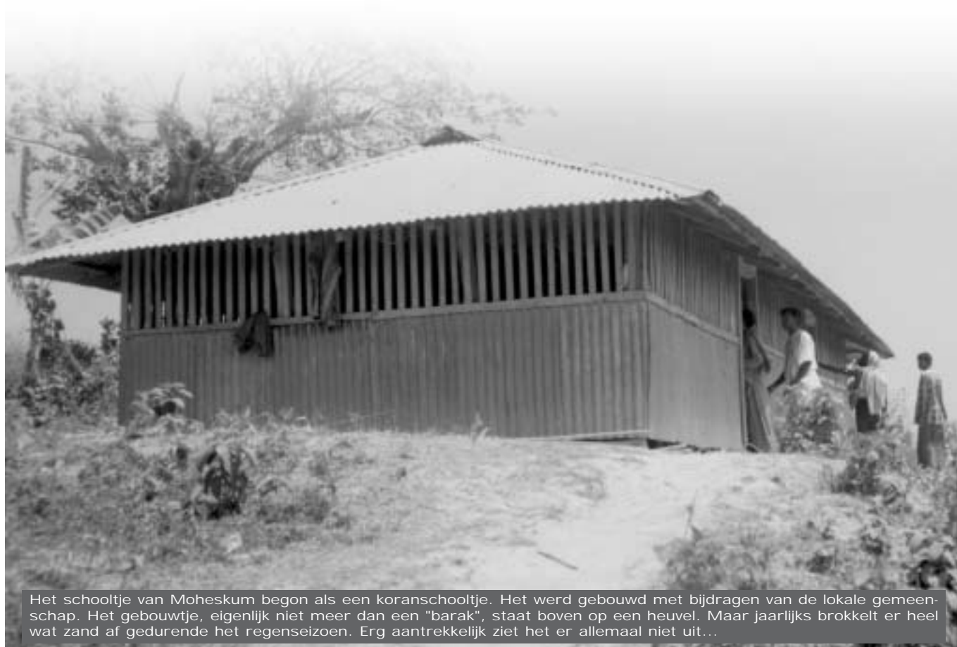
Het schooltje van Moheskum begon als een koranschooltje. Het werd gebouwd met bijdragen van de lokale gemeenschap. Het gebouwtje, eigenlijk niet meer dan een "barak", staat boven op een heuvel. Maar jaarlijks brokkelt er heel wat zand af gedurende het regenseizoen. Erg aantrekkelijk ziet het er allemaal niet uit...

In januari 1999 kon in Dakbhanga een eerste studiejaar van start gaan. Moheskum volgde voorzichtig een jaar later. Het schoolgebouwtje in Dakbhanga is inmiddels praktisch klaar. Waarschijnlijk wordt dit najaar het schooltje officieel geopend, wat niet betekent dat er nog niet gewerkt wordt. Integendeel. In de drie klaslokalen wordt les gegeven door drie leerkrachten. In het babyklasje, en van het 1ste tot het 5de leerjaar zitten een kleine 130 scholierij. De oude bordeauxkleurige uniformen zijn op kosten van de v.z.w. vervangen door nieuwe blauw en gele uniformen.